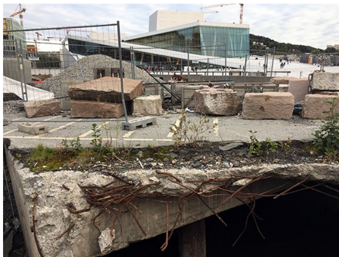
Oslo 2017, Rikke Luther